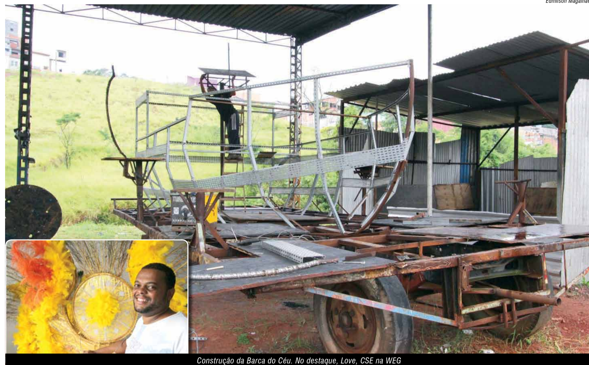
Construção da Barca do Céu. No destaque, Love, CSE na WEG